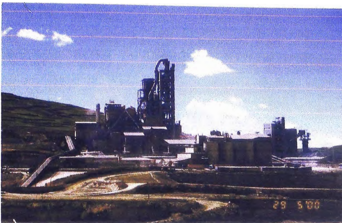
FOTO N° 3 Vista lateral de la Fábrica desde Cantera Cerro de Palo. Se observa antigua explotación calcárea.