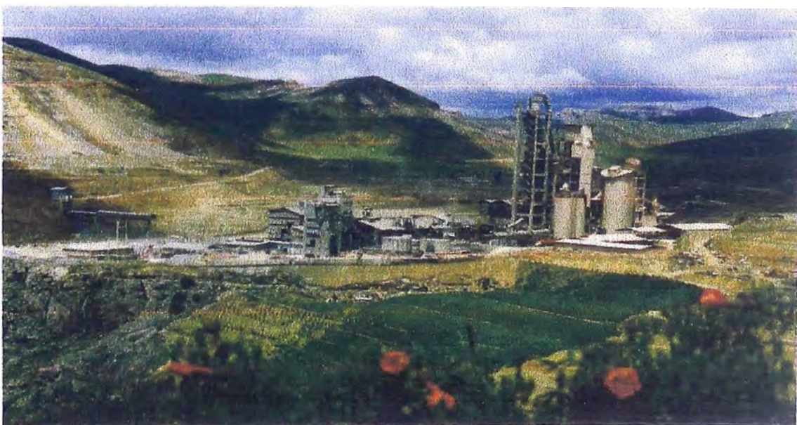
FOTO N° 4 Vista Posterior de la Fábrica Zona de Pacchon. Se observa la reforestación con trébol, grass, alfalfa