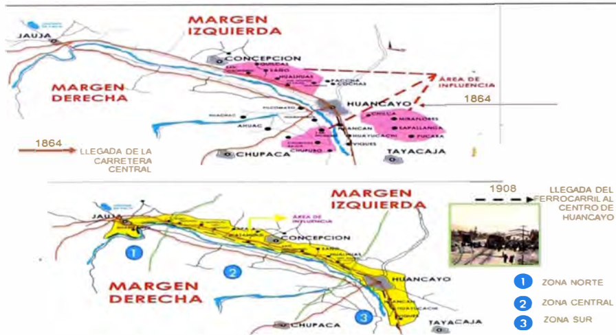
Plano 3: Valle del Mantaro