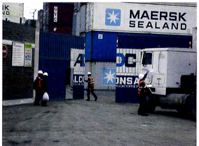
Figura 12. Operadores Logísticos : Ransa, Fargo Line, Asa