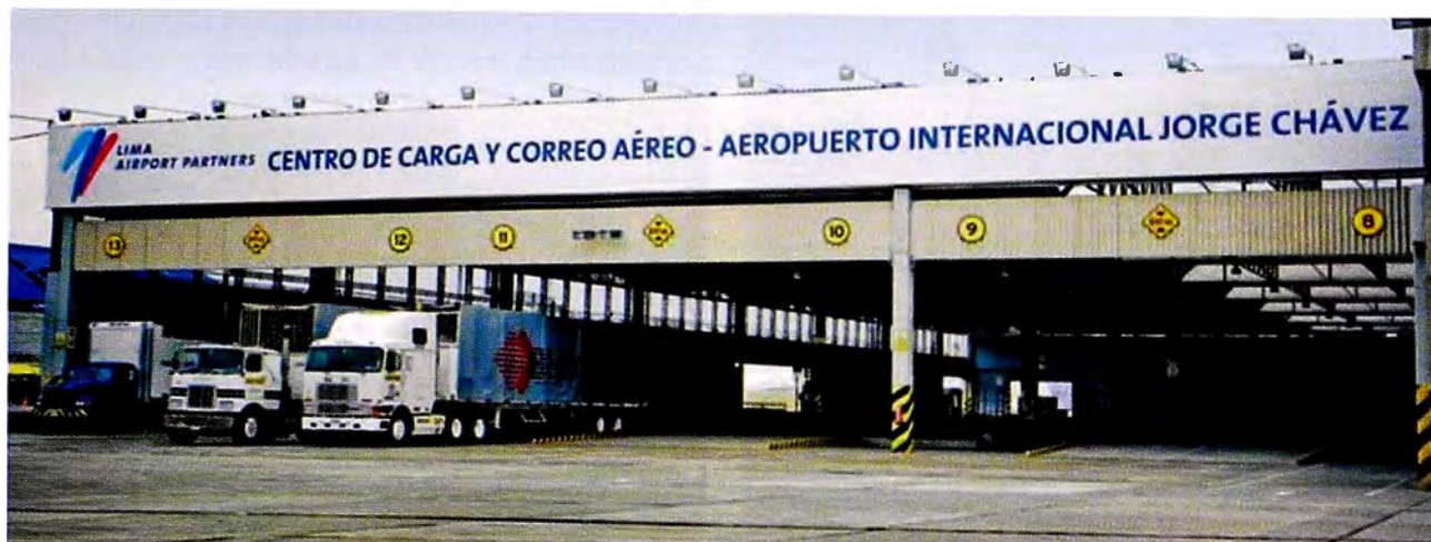
Figura 7. Aeropuerto Jorge Chávez, Servicios de carga, recuperado 22.11.14, 13.00h.

cas y almacenes) en el que era el fundo Oquendo y a lo largo de la avenida Gambetta. En segundo lugar, se tiene el colapso del sistema de transporte. En tercer lugar, escasea suelo urbano para responder a la demanda empresarial. Por último, se han encapsulado actividades residenciales incompatibles y disfuncionales al desarrollo de las actividades propias de las megaestructuras, el puerto y el aeropuerto.