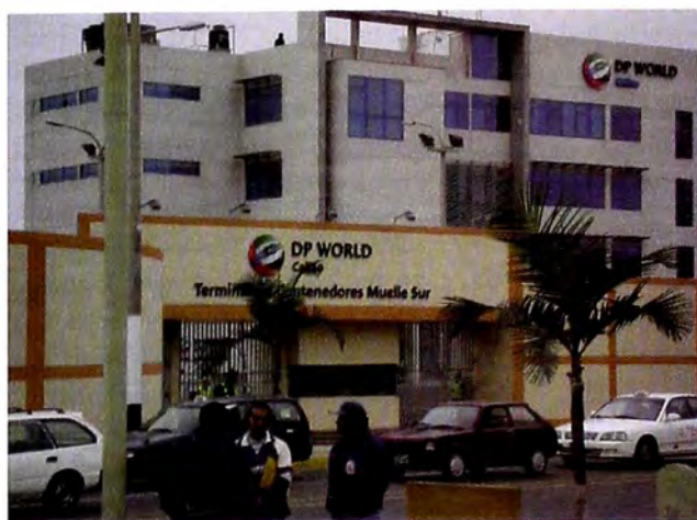
Figura 4. Instalaciones de DP World Callao Fuente: Archivo fotográfico Isis Bustamante, 2015.