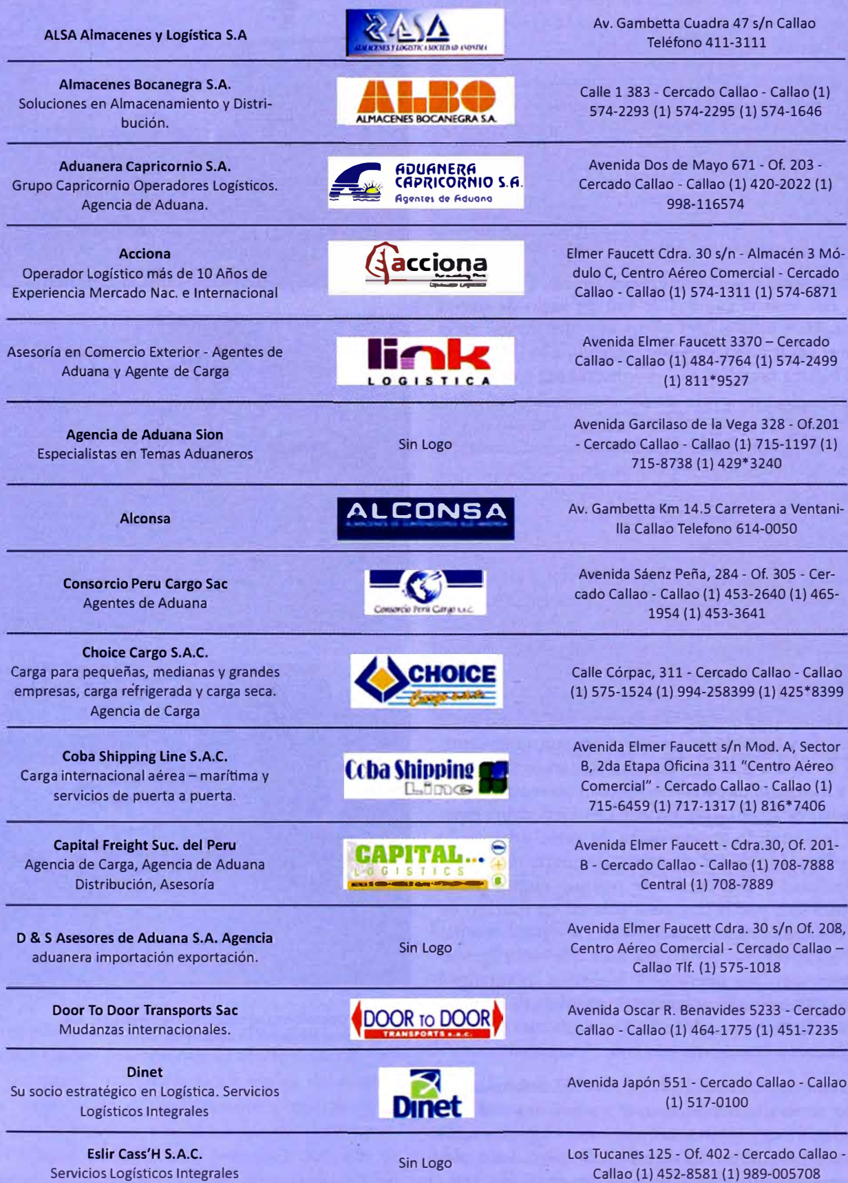
Tabla 4. Operadores logísticos