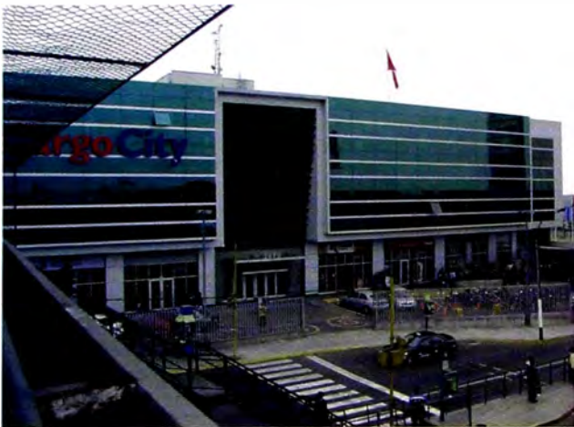
Figura 8. Centro Logístico, Lima Cargo City. Av. Faucett