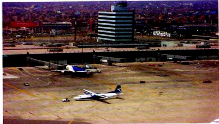
Figura 6. Vista de la Torre de Control del aeropuerto y zona de embarque con mangas. Aeropuerto Jorge Chávez. Callao, Perú. Año 2005 aprox.