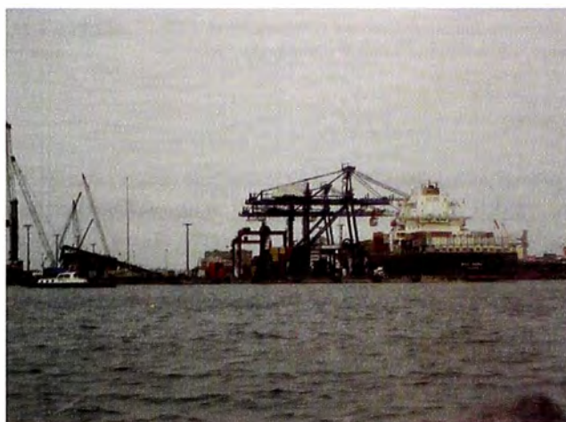
Figuras 2 y 3. Grúas puentes en Puerto del Callao