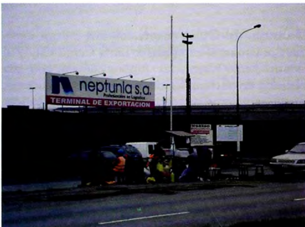
Figura 10. Centro Logístico, Neptunia S.A: Av Gambetta