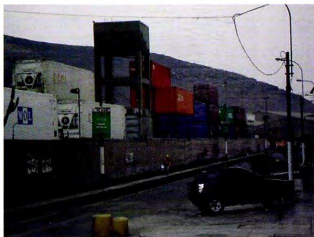
Figura 15. Terminales de carga de Operadores Logísticos Puerto seco Fuente: Archivo fotográfico Isis Bustamante, 2015.

Fuente: Municipalidad Provincial del Callao, 2010.