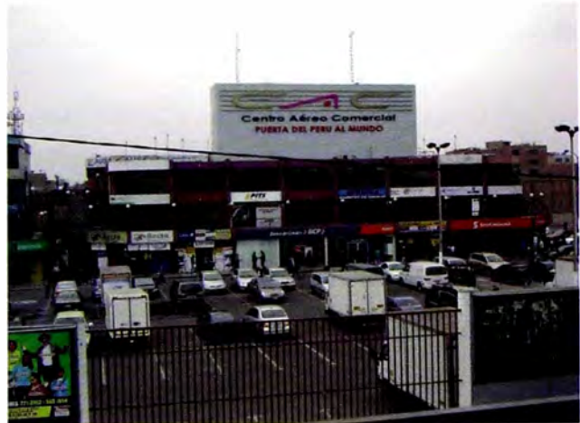
Figura 9. Centro logístico, Centro Aero Comercial Av. Faucett