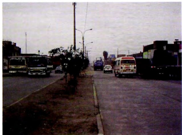
Figura 13. Tráfico en Av. Gambetta –Callao

Los terminales de almacenamiento en el Callao están definidos por el Reglamento de Almacenes Aduaneros de 1995 como los almacenes destinados a depositar la carga que se embarque o desembarque, transportada por vía aérea, marítima, terrestre o lacustre (Presidencia de la República, 1995) (ver Figura 15). Al respecto, la Gerencia de Transporte Urbano indica que el volumen de transporte de carga que sale del puerto del Callao al mes es de 50, 280 vehículos. Estos transportan insumos diversos y se movilizan a los almacenes ubicados en las avenidas Gambetta, Argentina, Elmer Faucett, Bocanegra, Colonial y Tomás Valle, así como la carretera a Ventanilla (ver Tabla 12). Hasta 2010, el número de viajes de vehículos al puerto ascendía a 1676 vehículos por día.