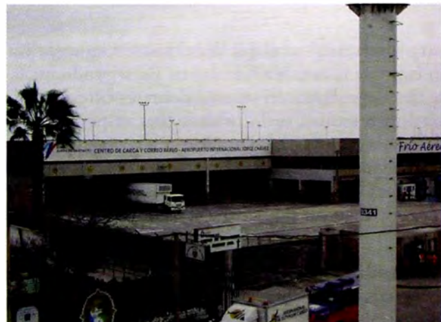
Figura 11. Centro logístico, Centro de carga de Aeropuerto Av. Faucett

proceso productivo), organiza, gestiona y controla dichas operaciones utilizando para ello las infraestructuras físicas, tecnología y sistemas de información, propios o ajenos, independientemente de que preste o no los servicios con medios propios o subcontratados” (Solís, 2013, s.n.)