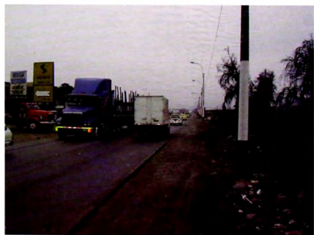
Figura 14. Av. Néstor Gambetta: julio 2010