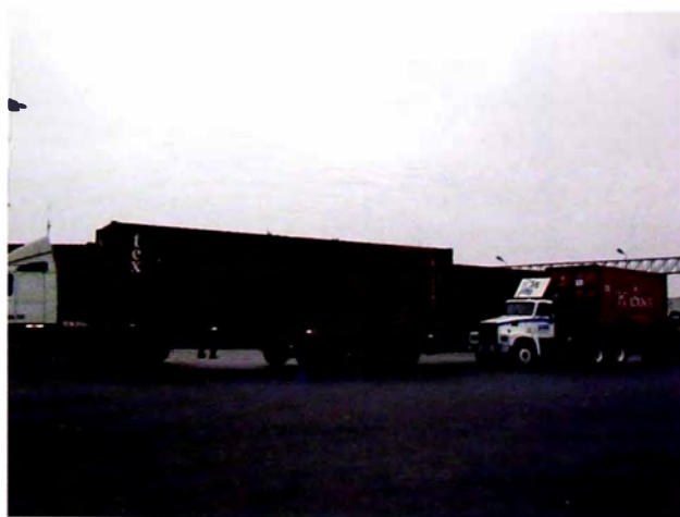
Figura 16. Transporte de carga pesada en camión