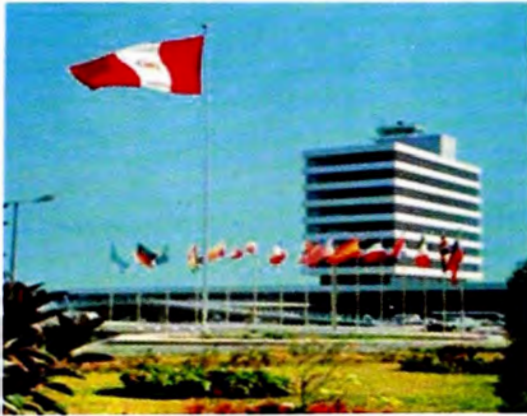
Figura 5. Aeropuerto Jorge Chávez, recuperado abril 2010, 6.30 pm.