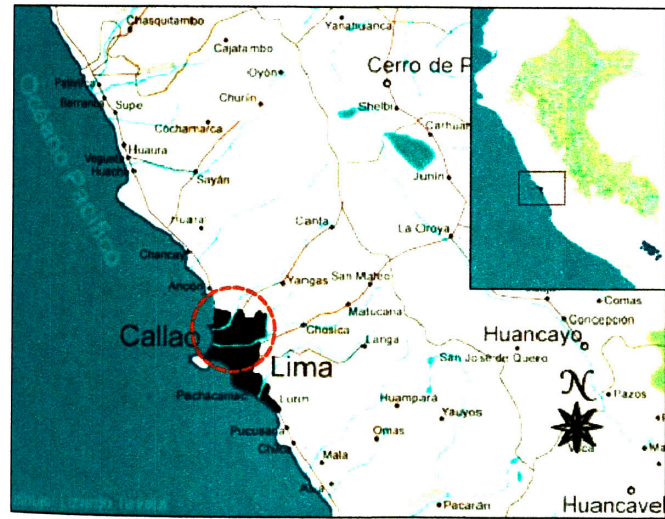
Plano de ubicación en el valle del Chillón.