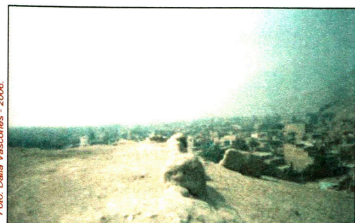
Plataforma Superior de la Huaca Tambo.

Técnica Constructiva: En la parte baja del lado este, se puede apreciar parte del antiguo camino que comunicaba con el sector de Alborada I con otro sector del valle, de aproximadamente 80m. de largo y es conformado por un muro perimétrico al borde de la ladera del montículo, formando un pasadizo entre la ladera y los muros de contención. El camino varía de 1m. a 2.10 de ancho de acuerdo a tramo seguido, sin embargo se observa que en su interior fue rellenado con material de piedra pequeñas y tierra. Los muros que lo contienen por lo general son dobles separados por rellenos de 80 cm. de grosor, compuestos de tierra, lajas de piedra y pedazos de adobes de 40cm. por 25 cm. por 8cm. Los muros tienen 1.20 de altura promedio y 1.70m. a 1m. de ancho, las bases de los muros externos presentan rellenos de piedras largas irregulares sobre la superficie rocosa.