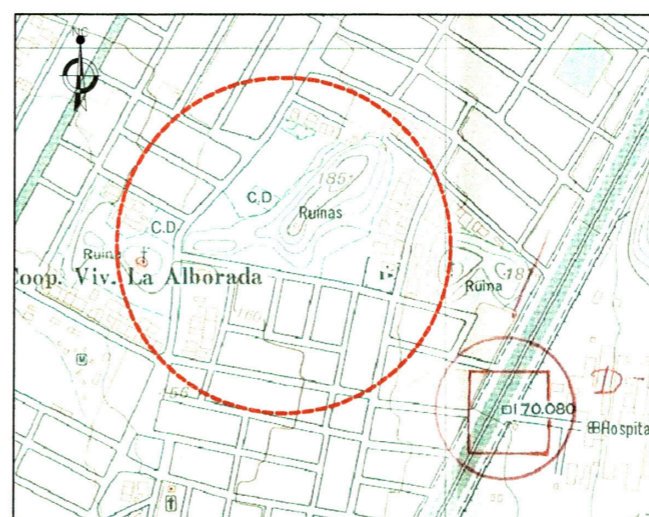
Ubicación Política Huaca Tambo ó Alborada II.