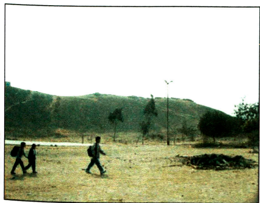
Vista desde el lado Norte.