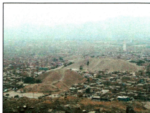
Vista del Conjunto de Alborada desde la Fortaleza de Collique.

ARQUITECTURA MILITAR PREHISPANICA EN EL VALLE BAJO DEL RIO CHILLON