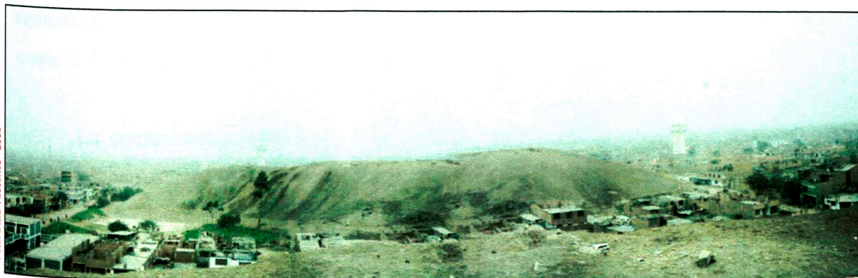
Vista Panorámica de la Huaca Tambo o Alborada II.