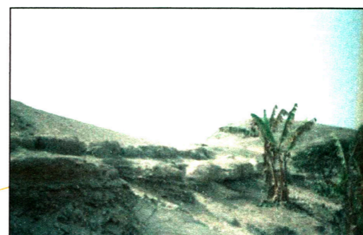
Antiguo camino en la parte baja de Alborada II.