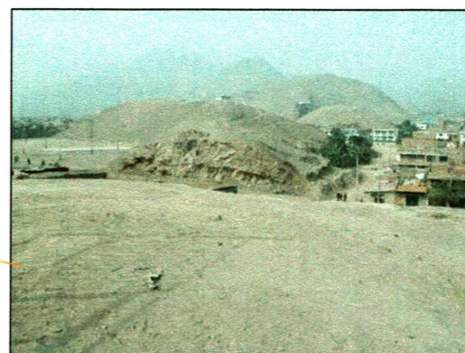
Vista de la Huaca Tambo en dirección a la Fortaleza de Collique, desde Alborada III.