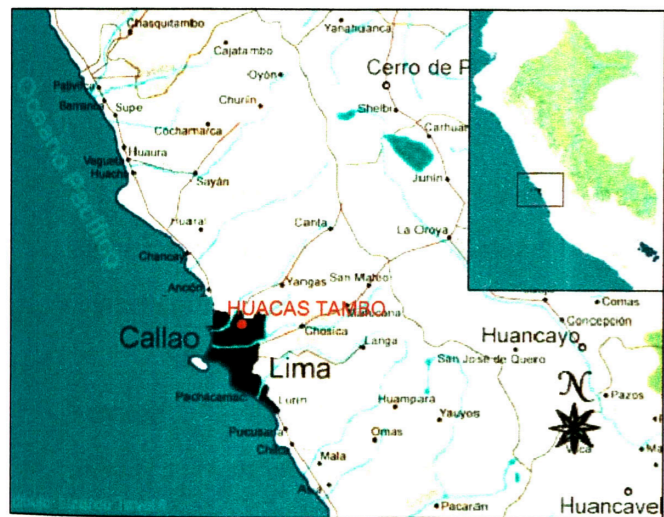
Plano de ubicación en el valle del Chillón.